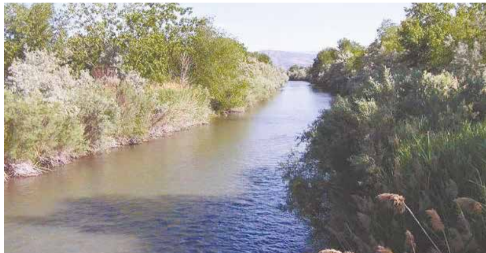
Река Иордан в наше время.

19 января мы отмечаем Крещение Господне, или Богоявление. Крещение – один из самых древних праздников в христианстве. Этот день связан с евангельским событием – крещением Иоанном Предтечей Иисуса Христа в реке Иордан. По главной традиции праздника освящают воду в храмах и на водоемах. Крещенская вода называется «агиасма» и считается святыней, исцеляющей душу и тело. // Митрополит Иоанн (ВЕНДЛАНД)