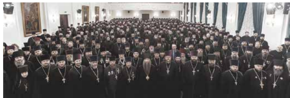
Общее фото участников епархиального собрания Сергиево-Посадской епархии.