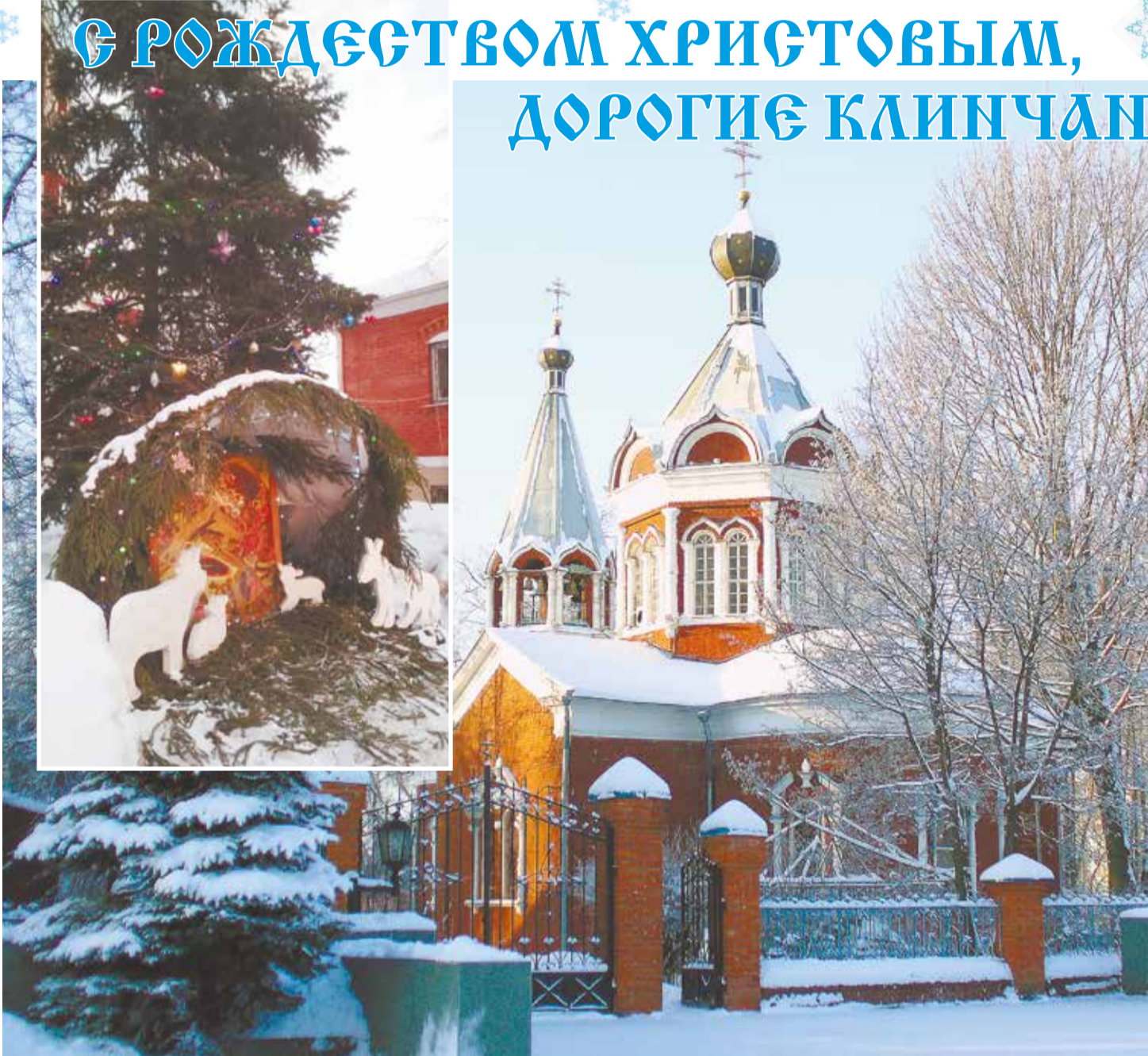
Храм иконы Божией Матери «Всех скорбящих Радость» г. Клин. Рождественский вертеп.