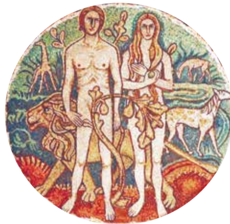
Мозаика «Адам и Ева в раю».

Люди питали и укрепляли себя общением с источником жизни – Богом. Между Творцом и Его высшими созданиями были полное доверие и взаимная любовь. Но человек решил, что