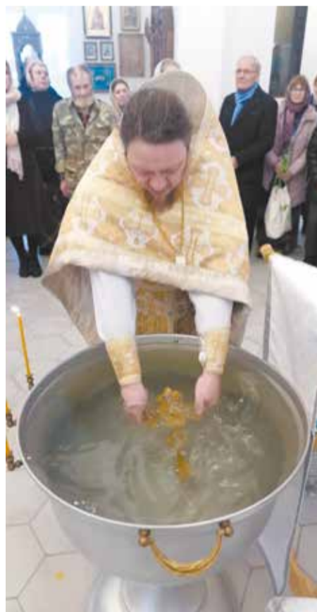
Освящение воды в праздник Крещения Господня в храме.

поощряет нашу любовь к святой воде и говорит: «Кто жаждет, иди ко Мне и пей» (Ин. 7:37).