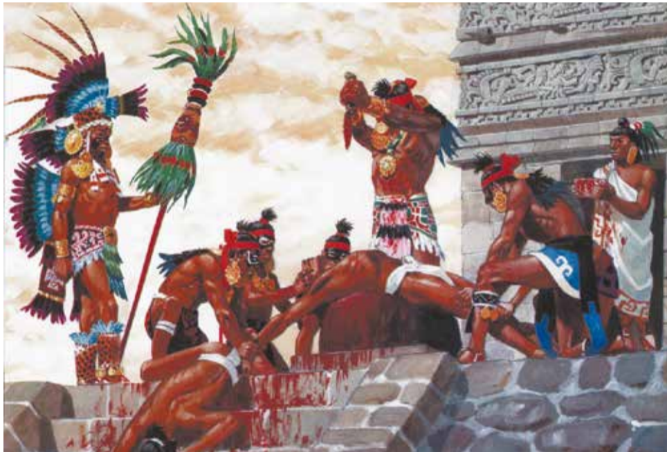
Жертвоприношение ацтеков.

Иисус Христос Своим воплощением, всей Своей земной жизнью и евангельским учением открыл важнейшие истины, которые мир, лежащий во зле, не может принять.