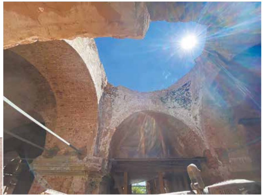
Верхний храм Троицкого собора.

на именной кирпич для возведения купола Троицкого собора. Жертвователи указывают имя конкретного человека, о котором будет возноситься церковная молитва и имя которого будет