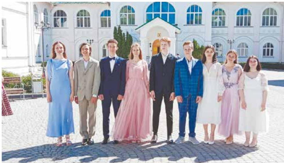
Выпускники 2022 г. гимназии «София» г. Клина в Коломне.