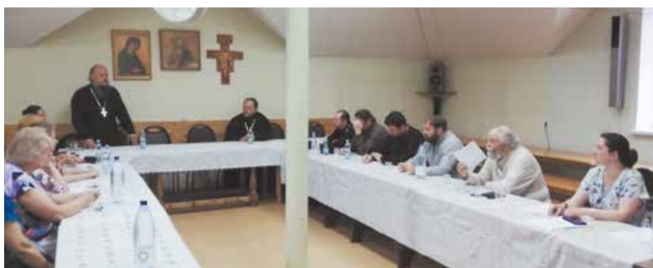
Встреча в Духовно-просветительском центре.