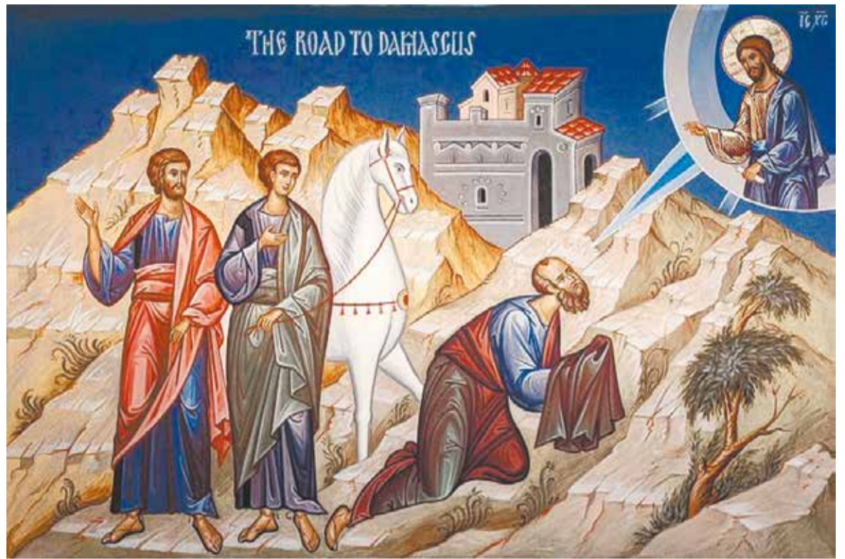
Икона «Обращение Савла».

В дальнейшем Савл, он же Павел, получил личное откровение от Самого Воскресшего Иисуса Христа о смысле Евангелия и всего христианского вероучения. Сам апостол писал коринфянам: Я первоначально преподал вам, что и сам принял (в откровении от Христа. – Прим. авт.), то есть, что Христос умер за грехи наши, по Писанию (ветхозаветному. – Прим. авт.), и что Он погребен был, и что воскрес в третий день, по Писанию, и что явился Кифе, потом Двенадцати; потом явился более нежели пятистам братьев в одно время, из которых большая часть доныне в живых, а некоторые и почил; потом явился Иакову, также всем апостолам; а после всех явился и мне, как некоему извергу (1 Кор. 15:3–8).