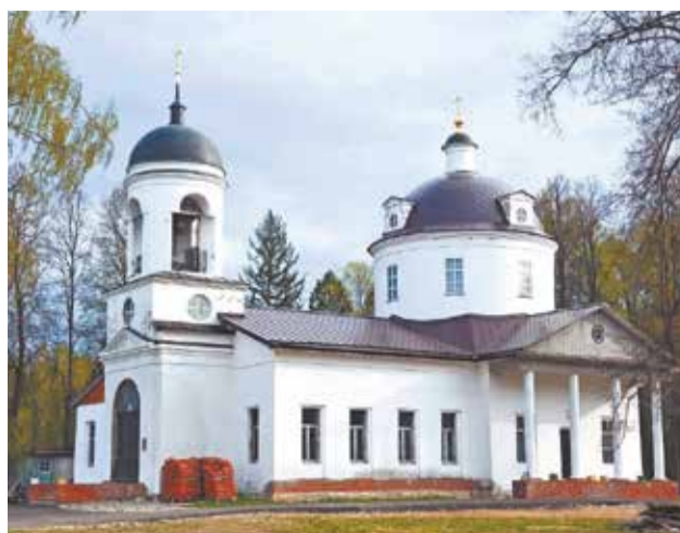
Казанский храм с. Кленково.

Восстановление храма – процесс долгий, требуются не только технологии, но и средства. И к предстоящему великому освящению нужно многое сделать. Силами одного нашего прихода с этим не справиться. Поэтому благодарим всех, кто нам помогает. На средства, собранные Клинским благочинием, приобретено