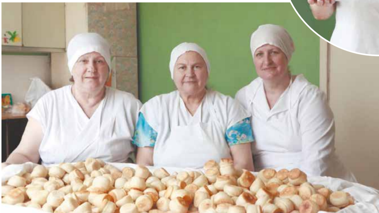
Просфорницы храма царевича Алексия г. Высоковска после работы.

Все послушания в храме от алтарника и до уборщицы, конечно, ответственны. Это как у человека: все части тела ему нужны.