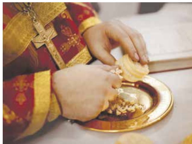
На проскомидии священник вынимает из просфоры частицы, читая записки о живых и усопших.

Наш коллектив не большой, дружный, все просфорницы с большим опытом. В этот