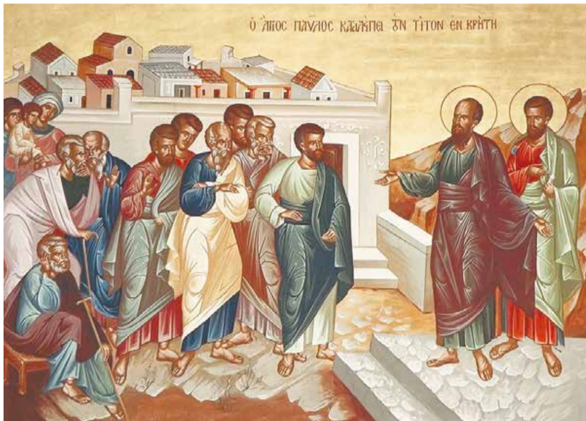
Фреска «Проповедь апостола Павла».

Крестом и Воскресением Господь победил грех – восстановил безгрешное состояние человеческой природы в Себе Самом и Воскрес телесно. Таким образом смерть духовная и телесная побеждены в человечестве Христовом.