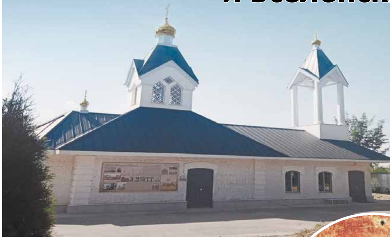
Петропавловский храм в с. Петровском.