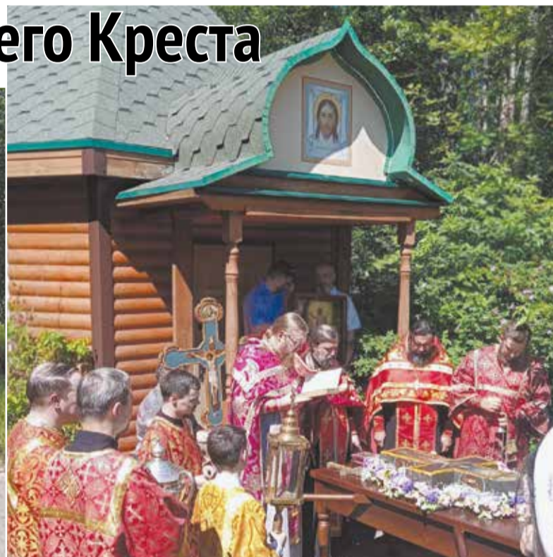
Молебен у каменного креста в завершение Крестного хода.