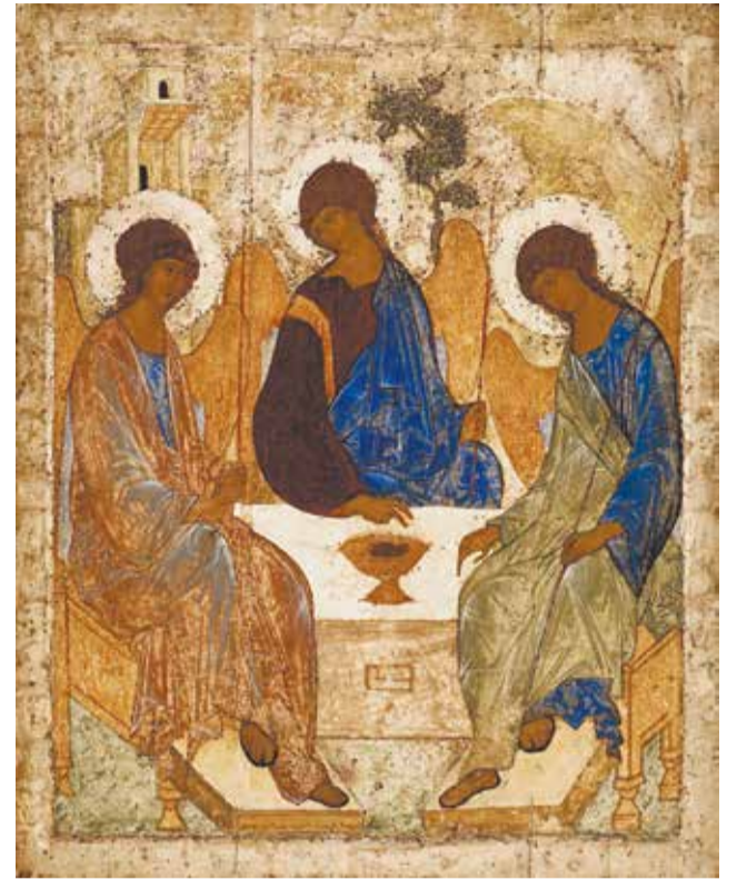
«Троица». АНДРЕЙ РУБЛЕВ.

Конечно, достичь его уровня невозможно, но тянуться к этому можно и нужно. Хорошо, что многие его иконы всё-таки сохранились, их можно увидеть в Третьяковской галерее, в Русском музее, других музеях страны.