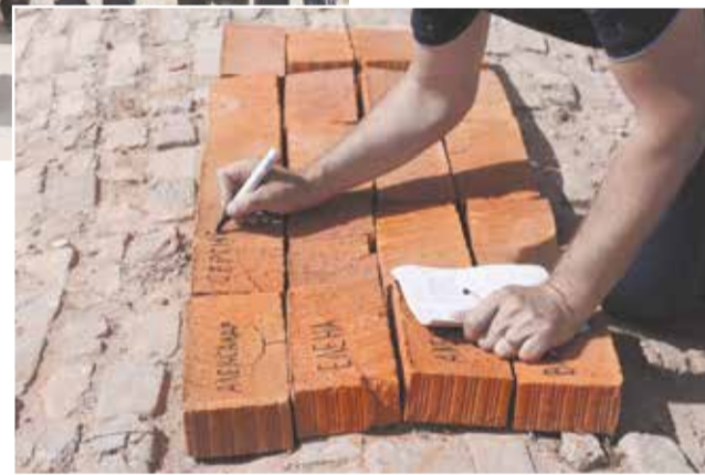
Подписывание именных кирпичиков.

Сумма пожертвования за один именной кирпичик – 500 рублей. Пожертвования за него принимаются по адресу: Советская площадь, дом 18, лавка Троицкого собора.