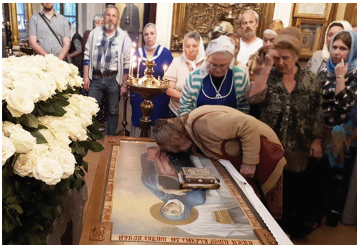
Скорбященский храм г. Клина. Прихожане прикладываются к Плащанице Пресвятой Богородицы.