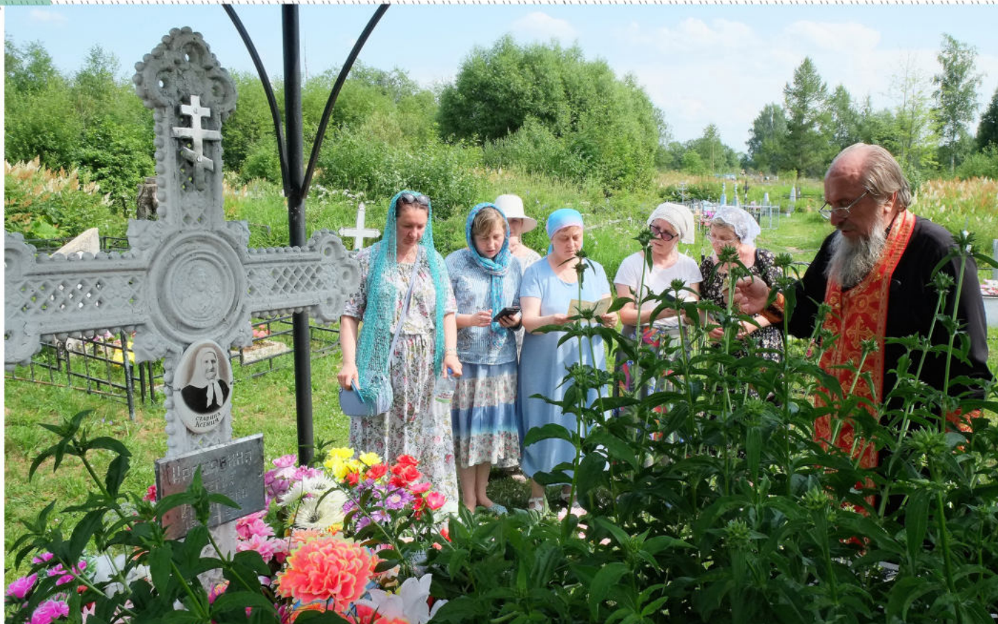
Панихида на могиле старицы Ксении