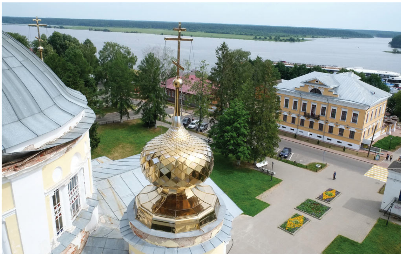
Вид с колокольни Успенского собора г. Мышкина

Отпуск, выходные и праздники всегда хочется провести с удовольствием и духовной пользой. Прихожане Скорбященского храма г. Клина летом посетили Мышкин – городок на Волге в Ярославской области. Наша паломническая поездка удалась: поверьте, маленький Мышкин достоин большого внимания! // Юлия ПАВЛЮК. Фото автора