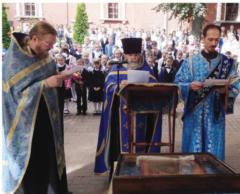
Молебен перед началом учебного года в Скорбященской церкви. г. Клина

Накануне нового учебного года мы решили поговорить об образовании. Сегодня каждый либо считает себя образованным человеком, либо стремится быть им. Чаще всего образование измеряют уровнем и спецификой учебного заведения: среднее или высшее, гуманитарное или техническое и т.д. Но само слово «образование» имеет более глубокий смысл и значение, чем просто получение определенных знаний, умений и навыков.