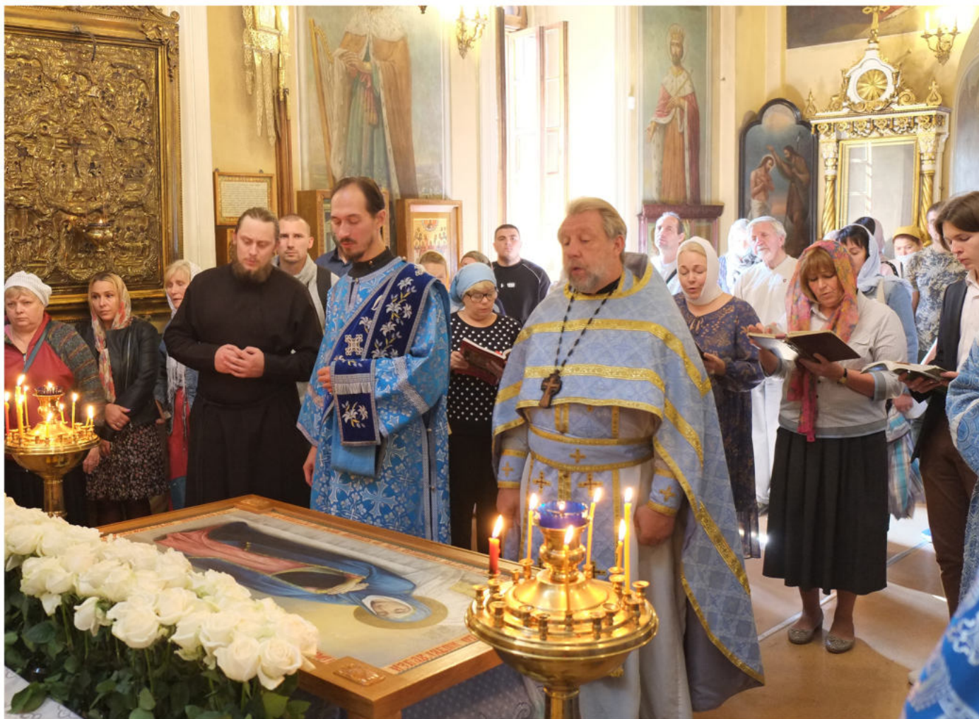
Величание Пресвятой Богородицы в Скорбященском храме.

«При рождении от Тебя Христа зачатие было без семени, при Успении Твоем – омертвление без тления; чудо с чудом соединилось» (седален по второй кафизме в русском переводе).