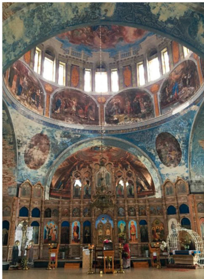
Интерьер Успенского собора г. Мышкина

Потрясающий вид на Волгу и окрестности открывается с колокольни Успенского собора, который по праву считается главным символом города и может являться одновременно и символом истории всей нашей страны.