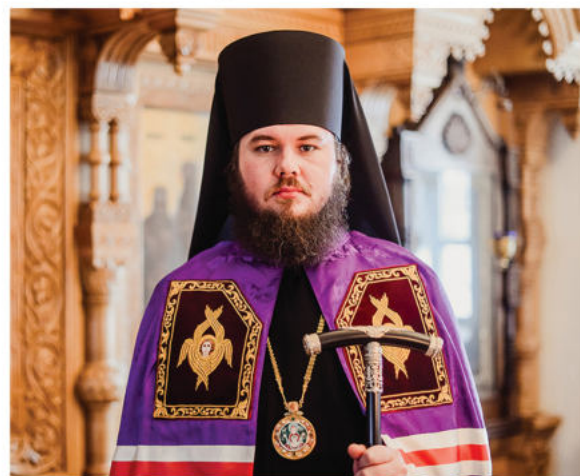
Епископ Сергиево-Посадский и Дмитровский Фома

Правящим архиереем новообразованной епархии с титулом Сергиево-Посадский и Дмитровский назначен Преосвященный епископ Фома, наместник Свято-Троицкой Сергиевой Лавры.