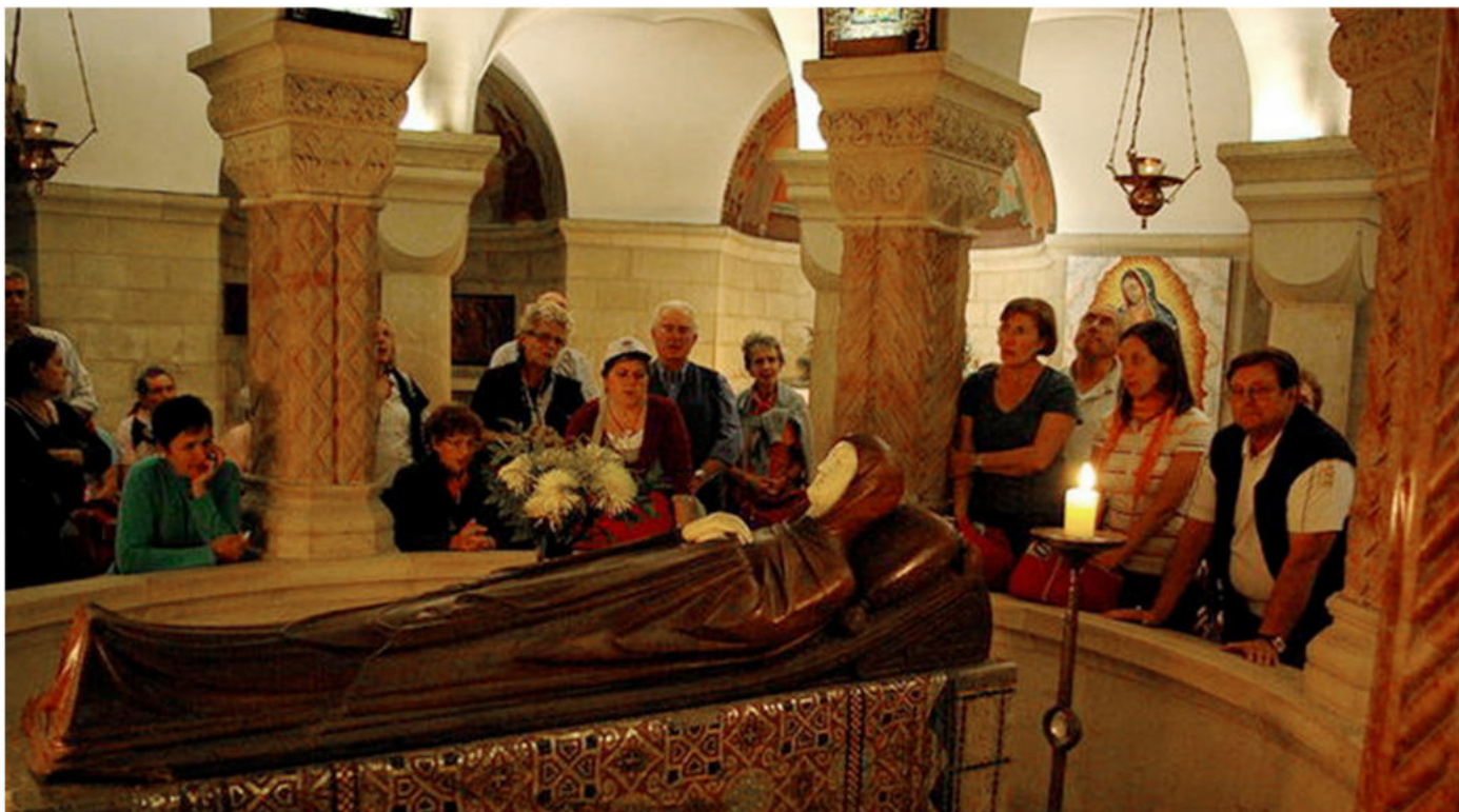
Скульптура Пресвятой Богородицы в католическом соборе Успения на горе Сион.