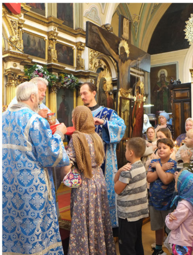
Праздник Успения Пресвятой Богородицы в Скорбященском храме.

Дева Мария Своей жизнью показала цель пришествия в мир Христа – спасение человека от греховного повреждения и уподобление человеческой личности Богу в духовном совершенстве. Смерть на время разлучает душу христианина с телом, но не с любящим нас Богом – Источником жизни. Пресвятая Богородица вместе со Своим Божественным Сыном преодолела смерть как последствие грехопадения людей. Она воскресла и обрела новое, прославленное тело, не подверженное страданию и старению, какое обретем и все мы, чада Православной Церкви, в день славного Второго Пришествия Христова.