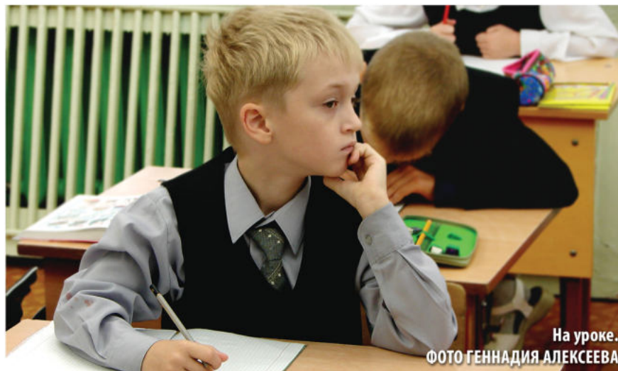
На уроке.