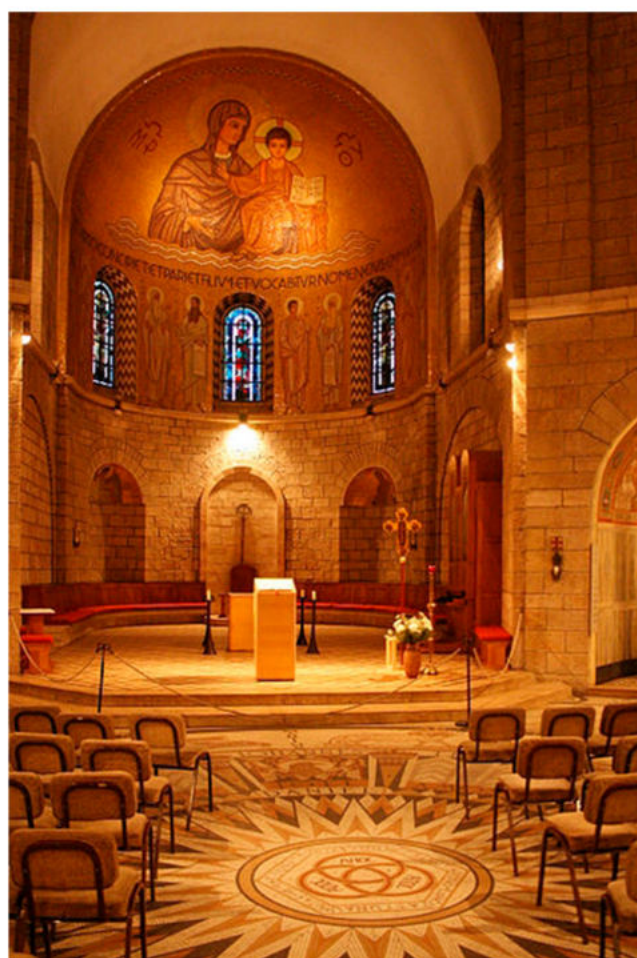
Интерьер собора Успения на горе Сион.

Её душа, расставаясь с земным телом, была с любовью принята в объятия Божественного Сына. Об этом так говорится в праздничном богослужении: «Изумлялись ангельские силы, видя своего Владыку на Сионе, принимающего руками Своими женскую душу, ибо Он пречисто Родившую Его, как подобало Сыну, призывал: иди, Честнейшая, прославиться вместе с Сыном и Богом» (тропарь 9-й песни канона в русском переводе). «Необъяснимо Вселившийся в чрево Твое, Богородица, при воплощении, Он (Иисус Христос. – Прим. авт.), приняв всесвященнейший дух Твой, упокоил у Себя, как Сын, воздающий долг» (тропарь 8-й песни канона в русском переводе).