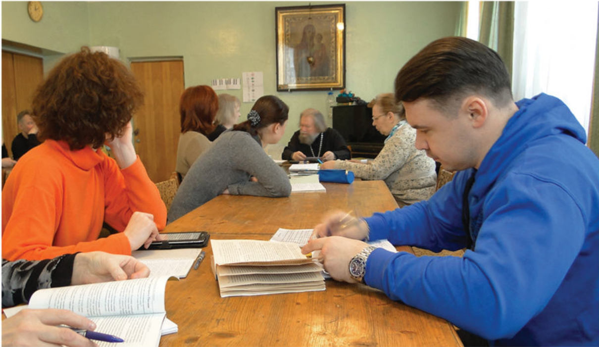
Учащиеся богословских курсов.