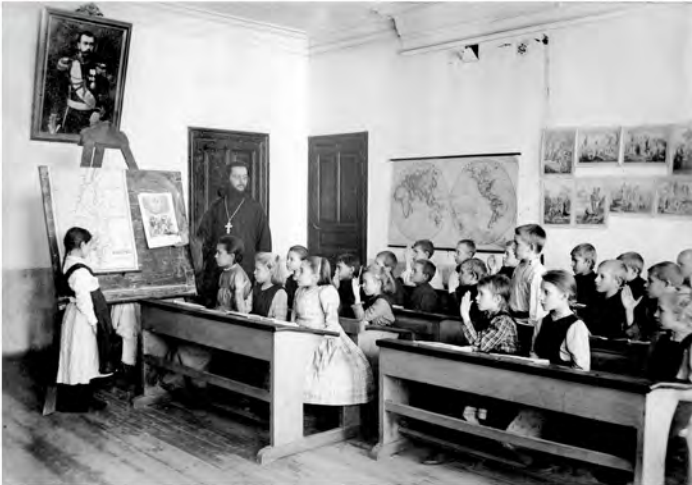
Урок Закона Божиего в начальном училище. Фото нач. XX в.

В обязанности учителей, особенно священника обучающего Закону Божию, вменялось воспитывать в учащих нравственное начало, объяснять им истины христианской веры и правила добродетели. Преподаватели должны были добиваться, чтобы дети чувствовали важность этих наставлений и своих обязанностей по отношению к Богу, ближним, родителям и начальству.