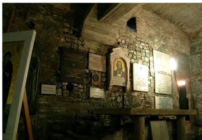
Предполагаемая гробница св. Кирилла в церкви Св. Климента

С 863 по 885 год трудами братьев были просвещены Болгария, Моравия, Паннония, Чехия, некоторые части Польши и Карпатской Руси и др. В этих странах началось повсеместное изучение славянской грамоты, Библии и богослужебных книг на славянском языке. После 885 года начинается распространение славянской письменности в Болгарии, Хорватии, Сербии и Киевской Руси.