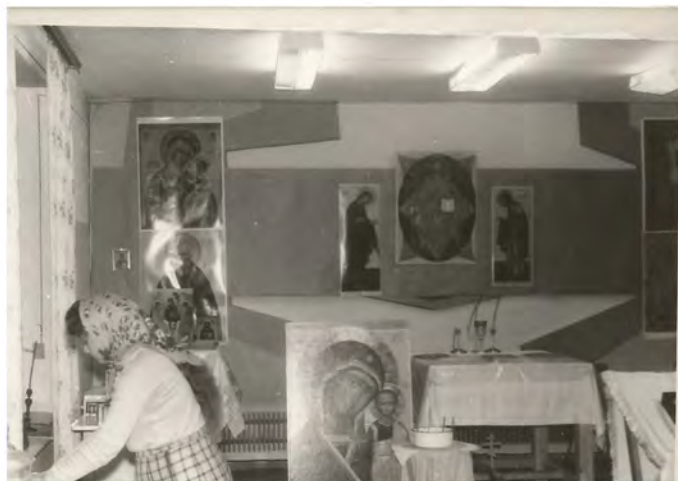
С этого начинался храм