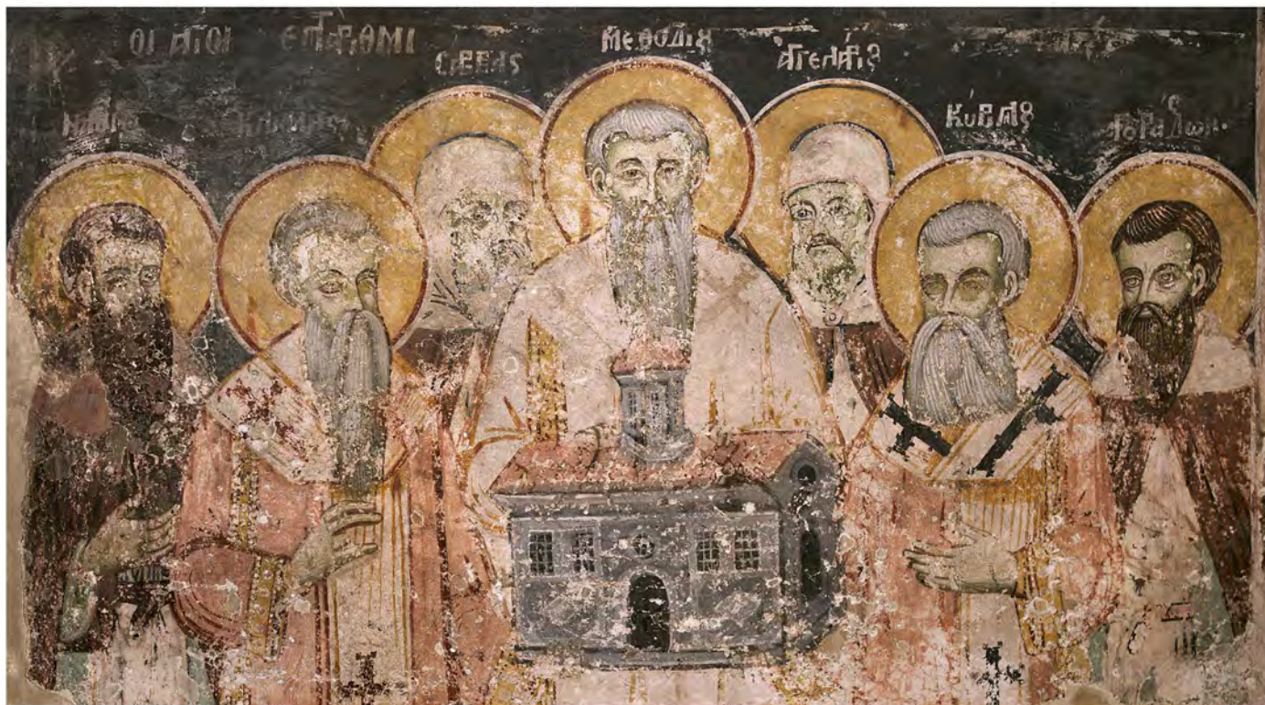
Святые Кирилл и Мефодий с учениками. Фреска монастыря «Святой Наум», ныне в Северной Македонии

Многих слов, употребляемых в Священном Писании, в славянском языке просто не существовало. Надо было придумать, как их перевести, как дать славянским словам новый смысл. Эта сложнейшая работа и была проделана Константином. Забегая вперед, отметим, что благодаря этим переводам славянский литературный язык заимствовал из литературного греческого языка законы грамматики, красивые обороты, величественное течение речи. Переведенные книги приобщили славян к богатейшей греческой (и еврейской) культуре.