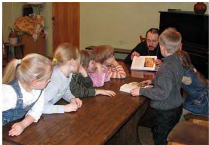
Урок в детской воскресной школе при Скорбященском храме г. Клина

И всё же большинство людей по-прежнему сохраняло благочестие и любовь к Церкви. Об этом свидетельствует творчество таких замечательных русских писателей, как Иван Шмелев и Василий Никифоров-Волгин. Сохранялась вера и в богоборческий советский период истории России.