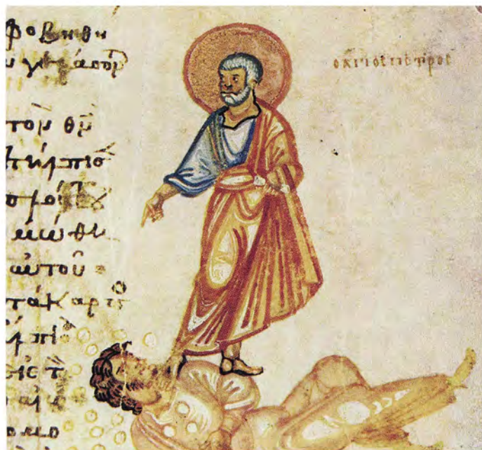
Петр, первоверховный апостол и Симон маг; Византия; IX в.; Псалтирь Пантократора

По мнению свт. Василия Великого, «невозможно нам соделаться способными к приятию Божественной благодати, не изгнав из себя порочных страстей, которые овладели нашими душами... И в сосуд, который был занят какой-нибудь зловонной жидкостью, не вымыв его, не наливают мира. Посему должно быть вылито помещавшееся прежде, чтобы могло вместиться вновь вливаемое». Такого же взгляда придерживается прп. Ефрем Сирий: «Когда благодать... встречает в сердцах наших зловоние нечистых помыслов, и тотчас отступает, не находя себе входа, чтобы вселиться и обитать в нас».