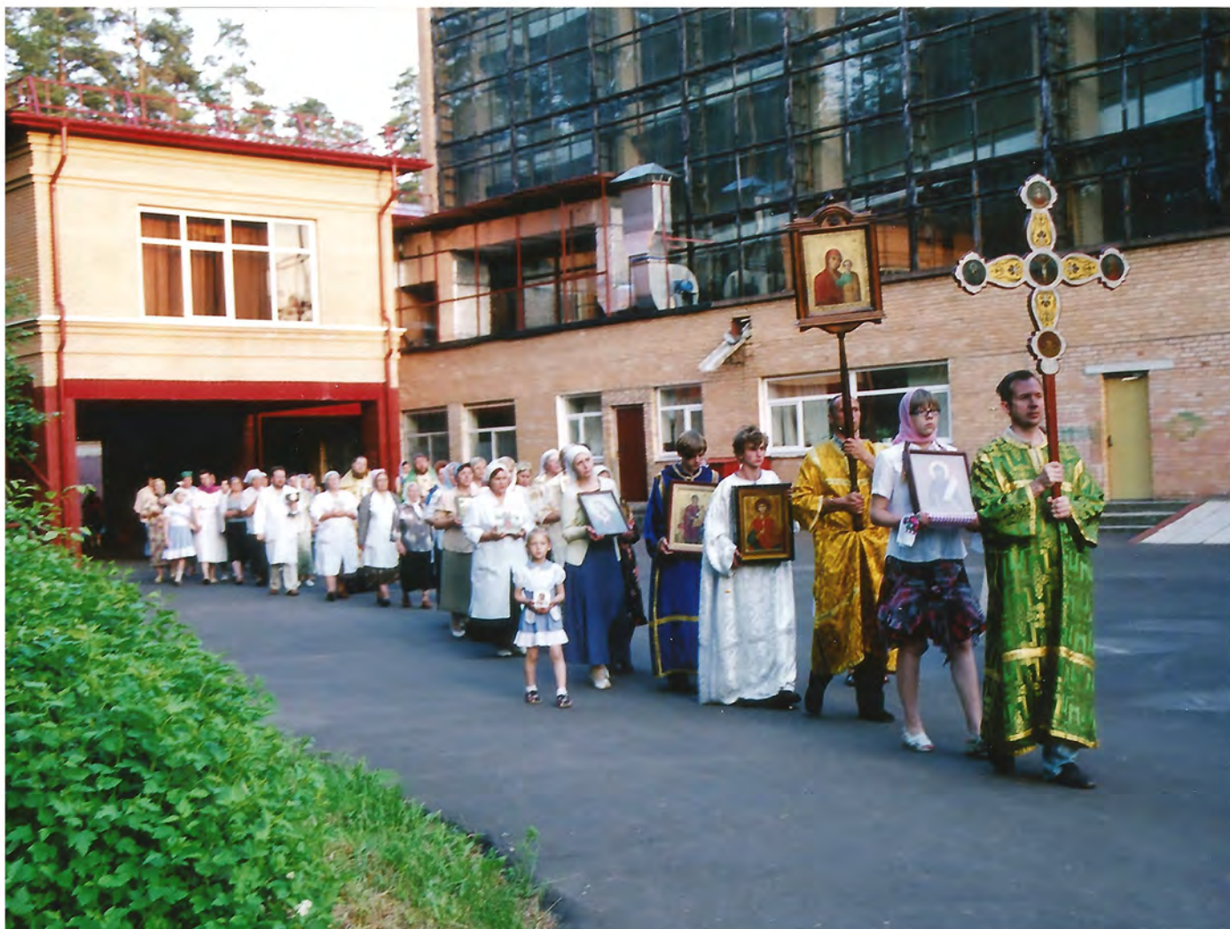
Праздничный крестный ход

Совместная работа больницы и храма уже более 25 лет является продолжением доброй древней традиции лечения пациентов не только физически, но и духовно.