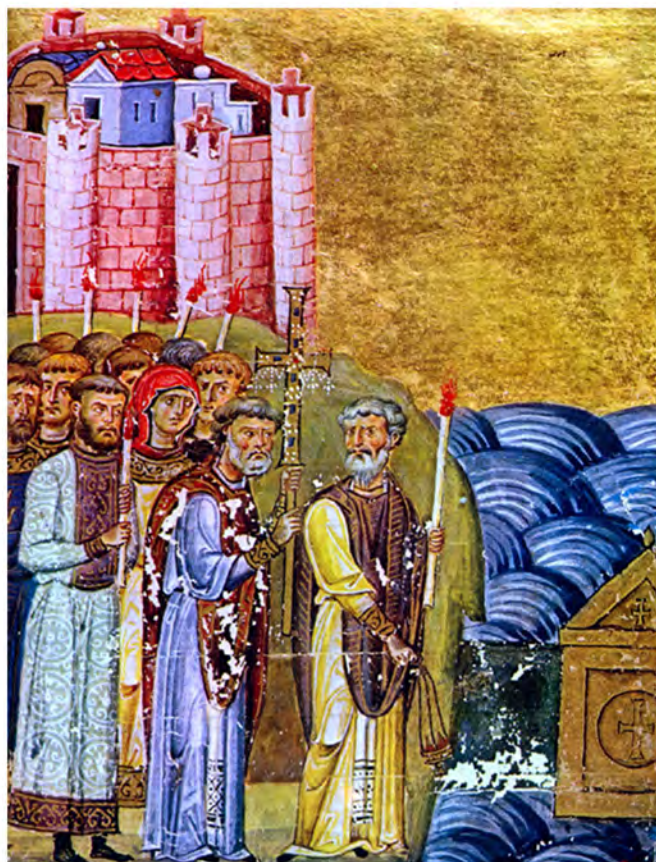
Обретение Кириллом и Мефодием мощей св. Климента. Миниатюра из Менология императора Василия II, XI в.

Около 860 года в Византию пришли послы от хазар. Так назывался народ, обитавший на территории Дагестана, части Крыма, Дона и Нижнего Поволжья. Хазары просили прислать к ним мудрых людей, которые бы рассказали об учении Христа. Хазарский верховный правитель выбирал, какую веру принять: ислам, иудаизм или христианство. Посланником к хазарам был назначен Константин, который уговорил Мефодия помочь ему в опасном и долгом путешествии. В крымском городе Херсонесе (по-славянски Корсуни) братья сделали продолжительную остановку. Здесь они чудесным образом обрели мощи святого Климента, ближайшего ученика апостола Петра. (Климента казнили в Херсонесе в изгнании, в самом начале II века.) В Хазарии в долгих беседах с мусульманами, евреями и хазарами