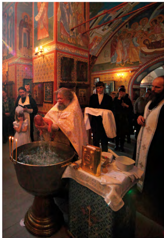
Крещение в Успенском храме с. Демьяново

В этом человеке зажигается искорка Божиего Царства, которая у ведущего богоугодную жизнь христианина должна со временем разгореться пламенем Божественной любви, согревающим не только собственную душу, но и всё, и всех вокруг. Так, преподобный Серафим Саровский говорил: «Чадю, молю тебя, стяжи (т.е. приобрети) мирный дух, и тысячи вокруг тебя спасутся».