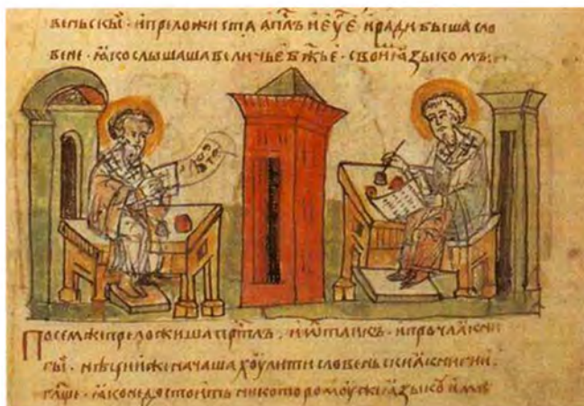
Святые Кирилл и Мефодий. Миниатюра из Радзивилловской летописи, XV век

Но дело, начатое Константином и Мефодием, продолжили их ученики, которые поселились в Болгарии и явились основоположниками болгарской литературы. Православный князь Борис (в крещении Михаил, 828-907 гг.), друг Мефодия, оказал поддержку его ученикам. Новый центр славянской письменности возник в Охриде (территория современной Македонии). Здесь в конце IX – начале X века один из учеников Константина Климент создал на основе греческого алфавита и глаголицы алфавит, получивший название кириллицы в память о святом Кирилле – человеке, который создал первую азбуку, пригодную для записи славянской речи. Более простая и удобная кириллица почти полностью совпадала с глаголицей и отличалась от нее лишь формой букв. Этой азбукой (с небольшими изменениями) мы до сих пор и пользуемся. (Сегодня кириллицей пишут в Белоруссии, Болгарии, Сербии, Северной Македонии, России, Украине, Киргизии, Монголии, Таджикистане, Абхазии, Боснии и Герцеговине, Черногории, Южной Осетии.)