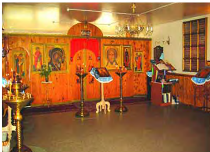
Внутренний вид храма прп. Агапита Печерского

Началась активная подготовка к открытию больничного храма на территории больницы. 12 мая 1994 г. митрополит Крутицкий и Коломенский Ювеналий дал благословение