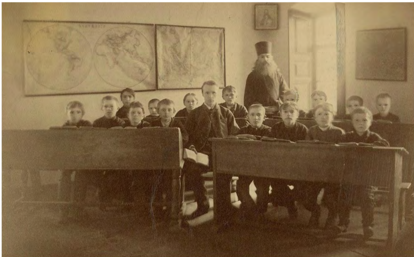
Церковно-приходская школа XIX века