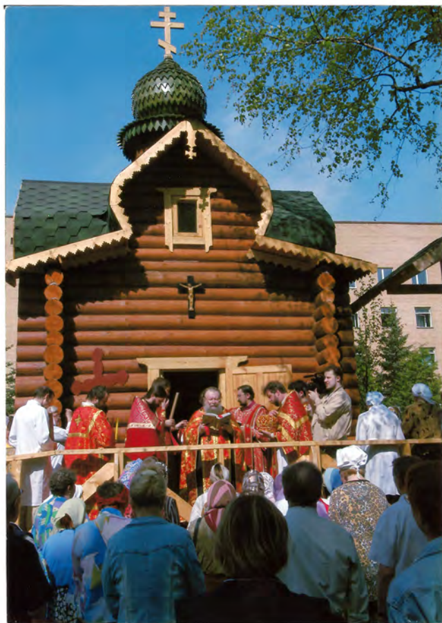
Освящение часовни на территории больницы

Благодатное сотрудничество Церкви и больницы продолжается и по сей день. Храм открыт ежедневно. Еженедельно совершается Божественная литургия, таинства Покаяния и Причастия, служатся молебны о здравии, сотрудники больницы и пациенты венчаются и крестят своих детей. В храме есть множество святынь: иконы с мощами преподобных Агапита Печерского, Сергия Радонежского, Оптинских и Глинских старцев, святителя Луки (Войно-Ясенецкого), преподобномученицы Великой княгини Елизаветы и другие. Любой сотрудник и пациент больницы может обратиться с вопросом или за консультацией к дежурным в храме и настоятелю в его приемные часы или во время беседы о вере.