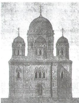
Предполагаемый храм имени св. Александра Невского с приделами: во имя Богоматери Скоропослушницы и Всех святых.