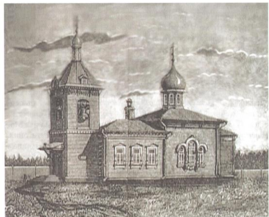
Свято-Троицкая церковь в Свято-Троицком Александро-Невском монастыре, Клинского уезда.

Долго не решалась мать Евтихия взять на себя бремя устройства общины, потому что место для нея выбрано безлюдное, мало обеспеченное в хозяйственном отношении. Правда учредители общины жертвовали в нее капитал, но средства эти были очень незначительны для такого великаго дела как устройство монашеской общины, только