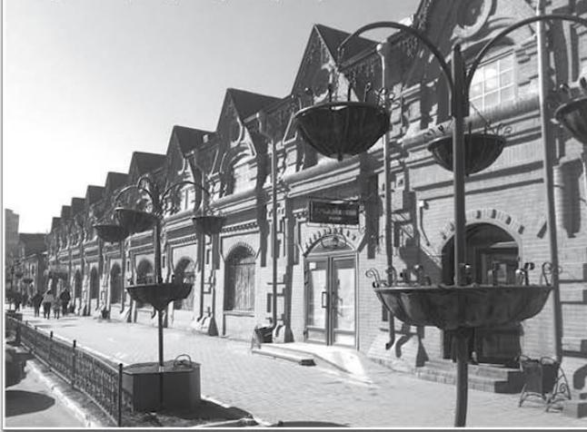
Так встретили новую весну наши древние Торговые ряды.