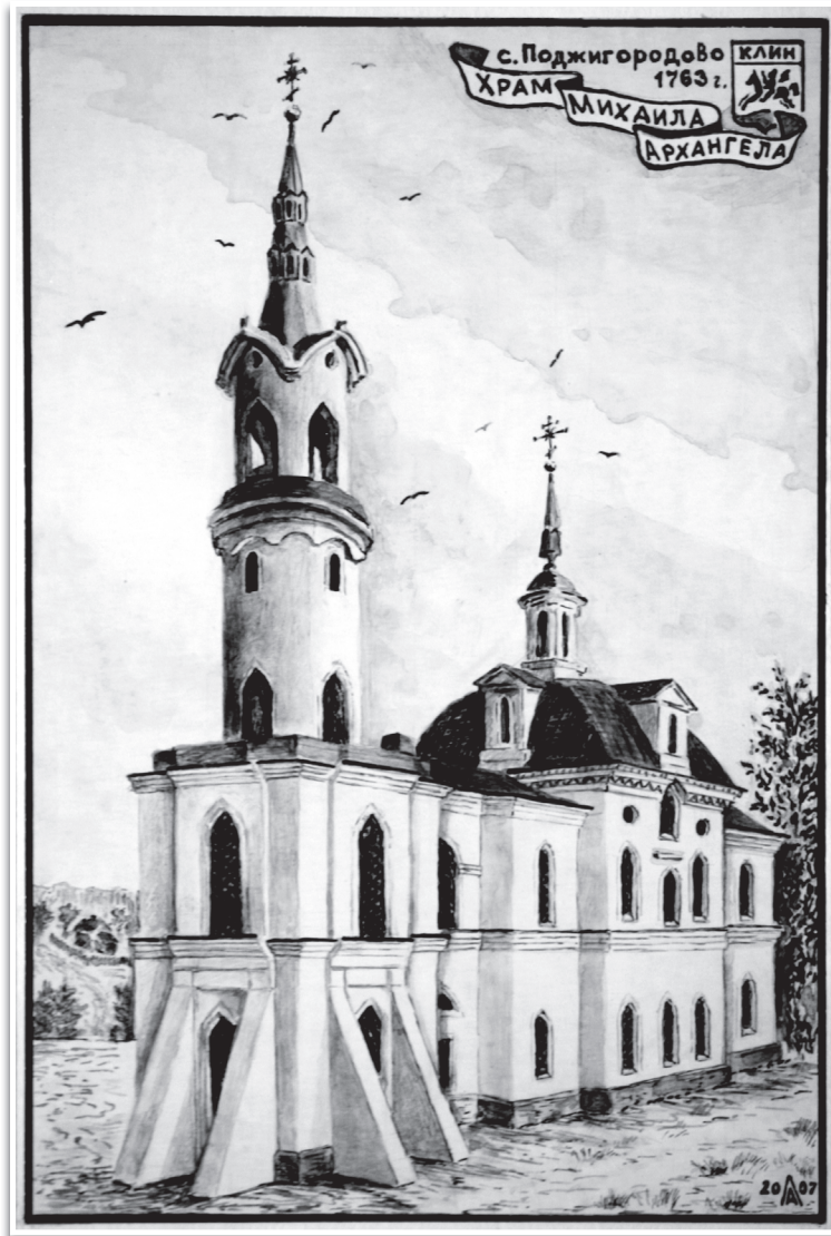
Вид на старинной открытке. Храм Михаила Архангела в Поджигородово.

Силуэт этого удивительно по красоте и архитектуре храма – некоторые клинчане помнят с детства. Деревня Поджигородово расположена, в общем-то, далеко от Клина, но в советское время здесь был летний трудовой лагерь для учащихся 16-й школы. Стены храма были порушены, что не мешало школьникам длинными летними вечерами увлекательно проводить здесь время, свободное от работы на полях! Можно было