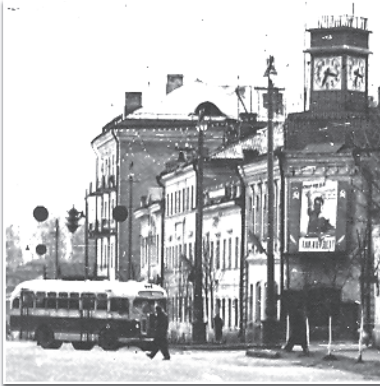
И сколько же поколений клинчан выросло под этими часами!

И тем приятнее сегодня видеть современные, точно идущие часы — на фасаде Управления образования.