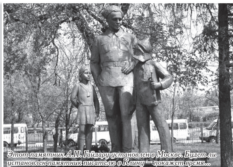
Этот памятник А.П. Гайдару установлен в Москве. Будет ли установлен памятник писателю в Клину — покажет время...

Приглашаем всех наших читателей, клинчан и людей, неравнодушных к жизни и творчеству А.П. Гайдара, принять участие в обсуждении темы. На взгляд редакции, первое, что необходимо сделать — это дать оценку художественному образу писателя, созданному в этом памятнике. Как скульптурно изображен писатель? Что хотел сказать скульптор своим произведением? Ответив на эти два вопроса, можно вести речь дальше, например, о выборе места... Таково мнение редакции, но мы готовы предоставить газетную площадь и для других мнений.