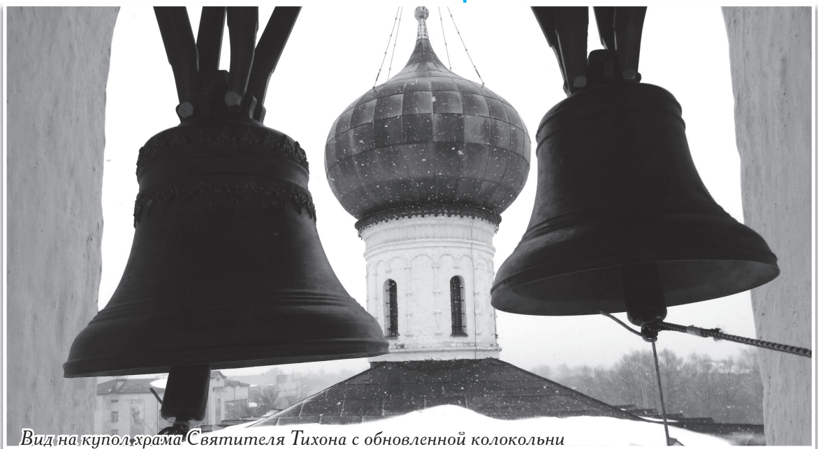
Вид на купол храма Святителя Тихона с обновленной колокольни

Улица Тихая дала название когда-то, в середине прошлого века, всему строящему «за шоссе» жилому микрорайону. Эта улица на самом деле была одна из самых тихих в городе: простенькие одноэтажные жилые дома с палисадниками. Один, правда, дом выделялся от остальных: он был странноватой архитектуры — кирпичным и двухэтажным, с неказистыми выступами и балкончиками.