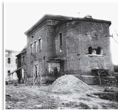
Такими были первые шаги восстановления храма Святителя Тихона.