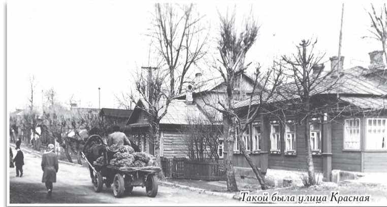
Такой была улица Красная

Как же, все-таки хорошо, что у нас четыре времени года!