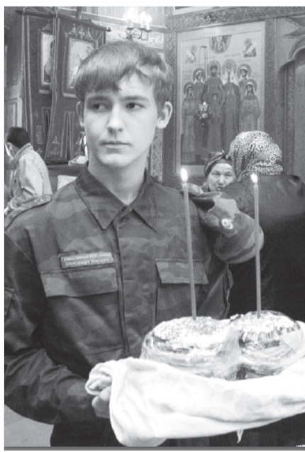
Канун Пасхи в Демьяновском храме. 2011 год.