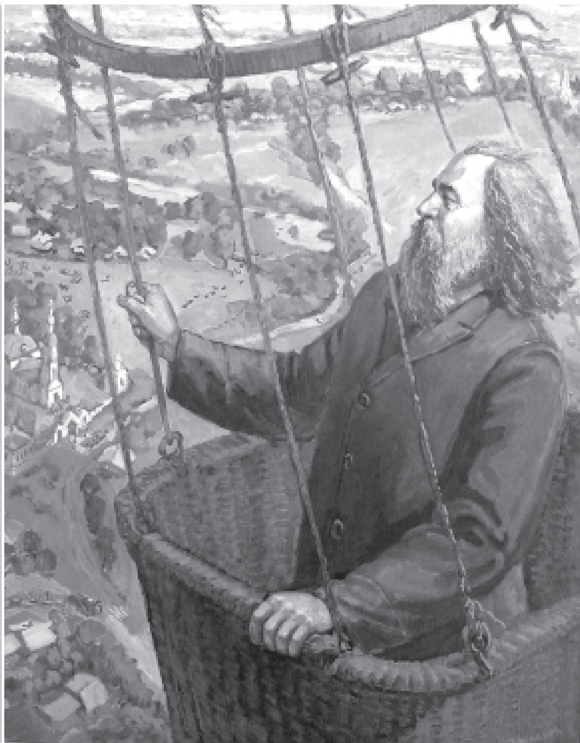
Евгений Бакланов. Фрагмент картины «Дмитрий Иванович Менделеев на воздушном шаре в окрестностях Клина».

лагали чай. Здесь же бегал какой-то находчивый мужичок и предлагал купить стеклышки для наблюдения затмения: