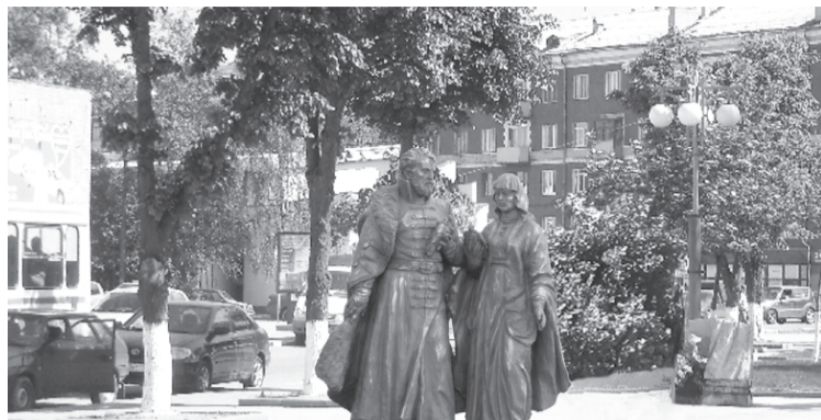
Святые благоверные Петр и Феврония считаются православными покровителями семьи и брака. Такую скульптурную композицию планируется установить в нашем городе к 8 июля 2012 года. Автором памятника является московский скульптор Константин Кубышкин. В его художественном активе памятники Ермаку в Сургуте (2010) и жене декабриста Марии Волконской в Иркутске (2011 год).

В 2008-2011 годах такие скульптурные композиции, выполненные разными авторами, были установлены в Муроме, Архангельске, Сочи, Ульяновске, Ярославле, Абакане, Ей-