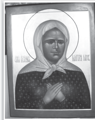
Святая Блаженная Матрона Московская изображена с открытыми глазами - на иконе в Успенском храме Боголеповой пустыни!

- Все так, все верно, так и должно быть! И только так,