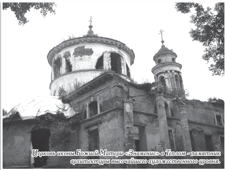
Церковь иконы Божией Матери «Знамение» в Теплом – памятник архитектуры высочайшего художественного уровня.

В подмосковном регионе начала работать программа «Дорога к храму», которая рассчитана на три года и создана для (далее – цитата) «обеспечения беспрепятственного и комфортного доступа прихожан к храмам Московской епархии и другим святым местам».