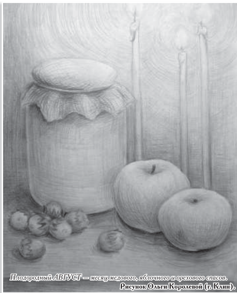
Плодородный АВГУСТ – месяц медового, яблочного и орехового спасов. Рисунок Ольги Королевой (г. Клин).

В зрелых плодах яблок содержится сахара (в основном фруктоза), пектиновые и дубильные вещества, органические кислоты (яблочная, лимонная, винная), витамины С, В1, Р, провитамин А, минеральные соли (железо, кальций, магний) и микроэлементы (йод, кремний, марганец, медь, натрий, калий, цинк, никель, молибден, кобальт), эфирные масла.