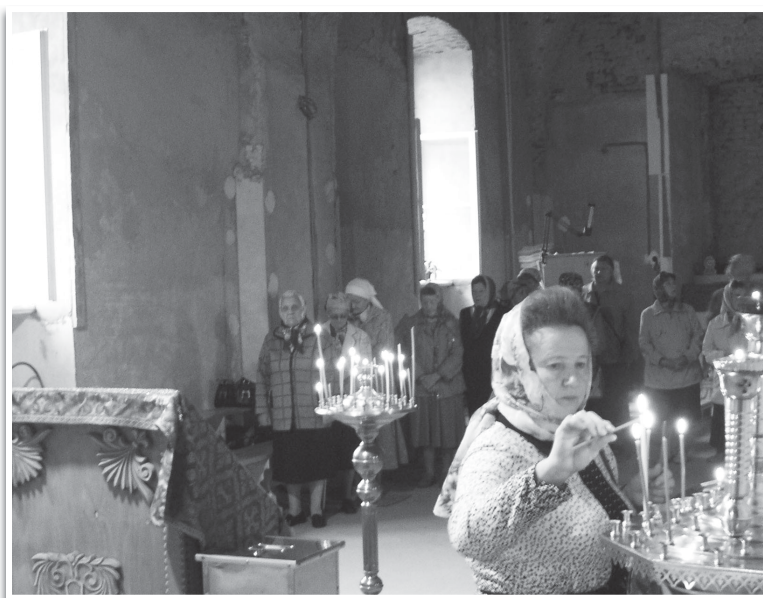
С 12 июля – Дня Святых Первоверховных апостолов Петра и Павла – богослужения в приходе Троицкого собора уже проводятся в просторном и светлом помещении с колоннами и высокими сводами.

Здесь уже «выведена» арочная кирпичная кладка и, соответственно, снесены «коммунистические новоделы». Теперь уже и не хочется вспоминать, что именно над Троицким алтарём шли несколько маршей лестницы на второй и третий этажи, которые сейчас демонтируются.