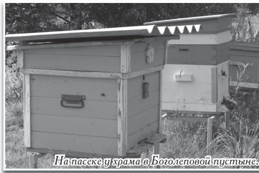
На пасеке у храма в Боголеповой пустыне.

А почему так получается, Понять пусть каждый постарается: Живет Мария, жить не ленится, А счастье никуда не денется.