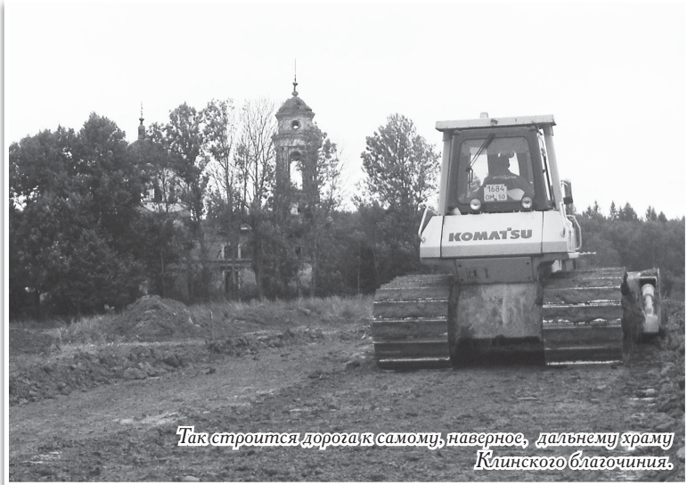
Так строится дорога к самому, наверное, дальнему храму Клинского благочиния.