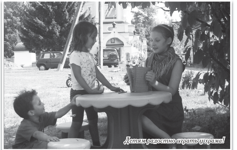
Детям радостно играть у храма!