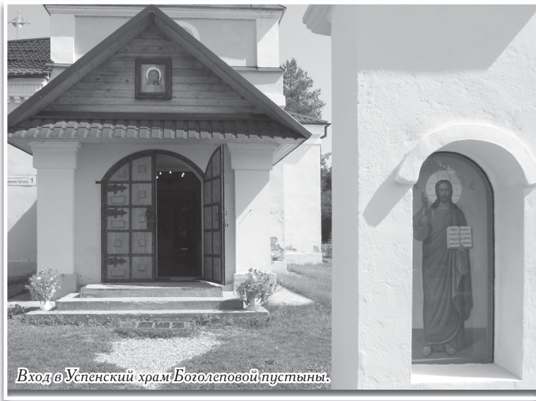
Вход в Успенский храм Боголеповой пустыни.

дицины и духовный писатель, епископ. Он канонизирован Русской православной церковью в августе 2000 г. В земной жизни он носил очки. Так вот, представляете, что на первых иконах его изображали в очках! И только через несколько лет после прославления, архиепископа Луку стали изображать на иконах без очков. Так и с Матроной Московской. Повторяю, слепых в Царствии Божьем нет!