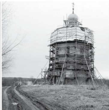
Вознесенский храм в Тархове и Одитриевский храм в Городище находятся друг от друга на расстоянии колокольного звона...

...С магистрали Клин-Волоколамск мы сворачиваем на Дятлово и едем до указателя на деревню Мащерово. На пути — древнее село Городище. Нам сюда, нам нужен здесь, в этом селе, храм Смоленской иконы Божией Матери «Одигитрия». От шумной магистральной автодороги до храма в тихом селе Городище — 8 километров.