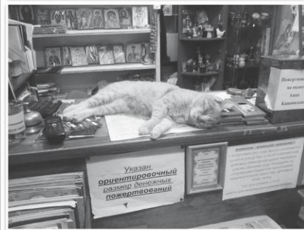
«Пока у них в святой лавке перья, можно хоть спокойно вздремнуть!»